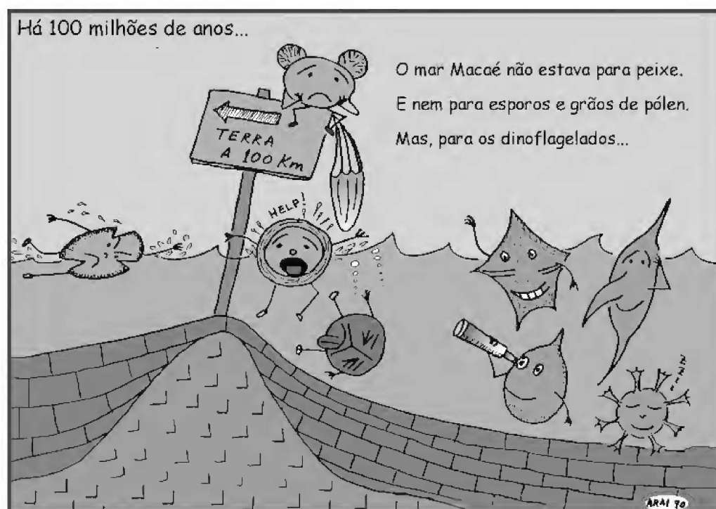
Fig.1- Cartoon mostrando a razão da escassez de palinórfos continentais na Formação Macaé, Bacia de Campos (desenho do autor).

da formação, estes organismos não têm sido capazes de oferecer mais do que duas ou três unidades bioestratigráficas. É também sabido que ambiente de plataforma carbonática caracteriza-se pela deficiência de aporte terrígeno. Não tardou a perceber-se que o arcabouço palinoestratigráfico tradicional (e.g., esquema de REGALI, UESUGUI & SANTOS, 1974a, b) baseado sobretudo em palinórfos terrestres também era pouco útil para a exploração da Formação Macaé (Fig.1). Alguns níveis dentro da formação revelaram conter até 100% de palinórfos marinhos (dinoflagelados, acritarcos e palinoforaminíferos). Assim, a PETROBRAS sentiu a necessidade de elaborar um esquema baseado principalmente nesses organismos. O primeiro arcabouço baseado essencialmente em palinórfos marinhos foi proposto por UESUGUI (1976), que adotou três espécies de dinoflagelados e uma de acritarco, para subdividir a Formação Macaé. Desde o final dos anos 80, vem se experimentando grandes progressos na Palinóstratigrafia marinha baseada principalmente em dinoflagelados. Atualmente, no cadastro da PETROBRAS existem centenas de dinoflagelados-guias do Cretáceo. E, hoje, os esquemas palinoestratigráficos com ampla incorporação de espécies de dinoflagelados passaram a ser utilizados na maioria das bacias da margem continental brasileira.